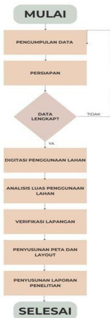
Gambar 2. Diagram Alir